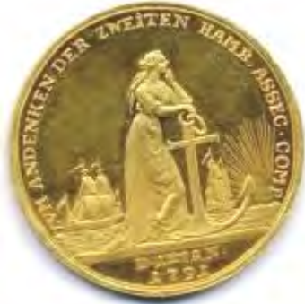
Médaille de compagnie d'assurance maritime 1791 Hambourg Inv. N-6009