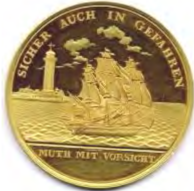
Médaille de compagnie d'assurance maritime 1797 Hambourg Inv. N-6010